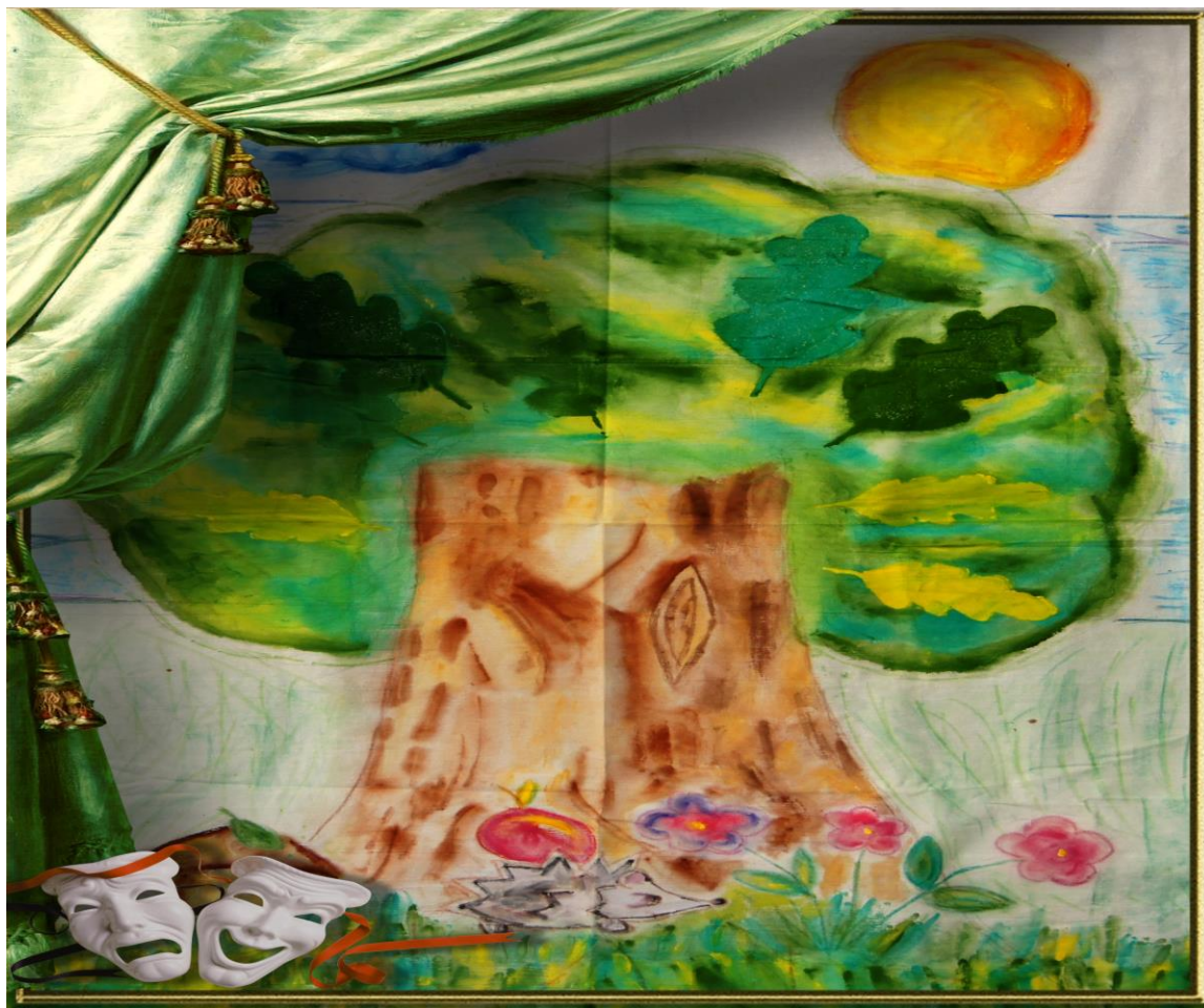
Панно № 5 для инсценировок «Дуб». Холст, акварель. Работа учащихся.