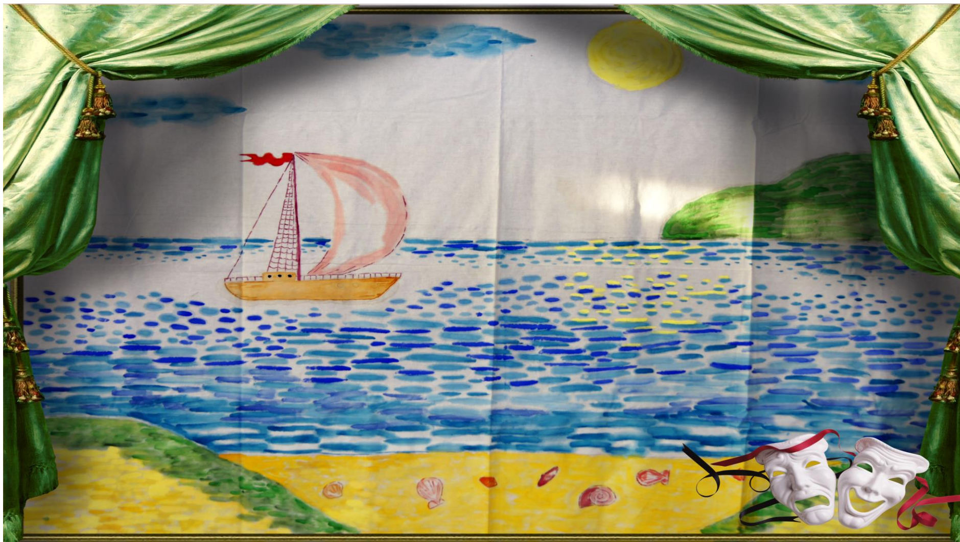
Панно № 3 для инсценировок «Белеет парус одинокий...» Холст, акварель. Работа учащихся.