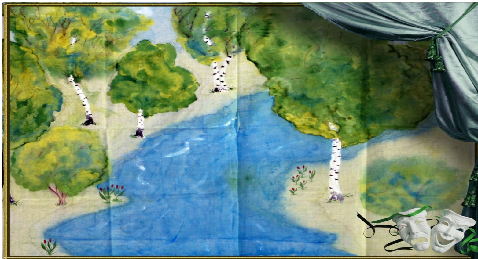
Панно № 1 для инсценировок «По мотивам пейзажной лирики» Холст, акварель. Работа учащихся.