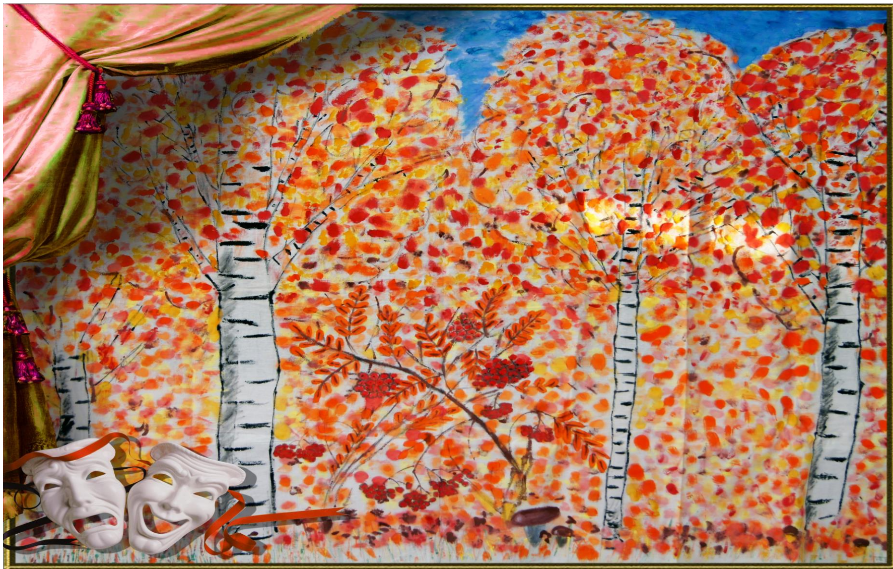
Панно № 4 для инсценировок «В саду горит костёр рябины красной...» Холст, акварель. Работа учащихся.