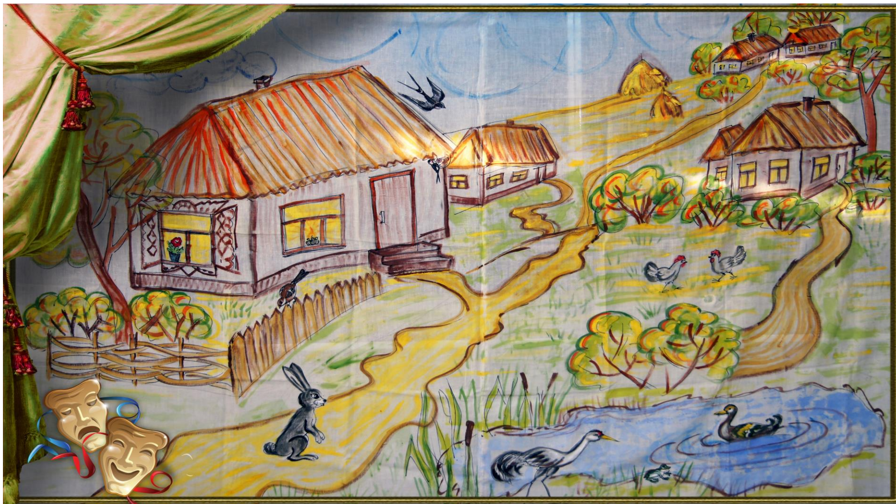
Панно № 2 для инсценировок «Деревенский пейзаж». Холст, акварель. Работа учащихся.